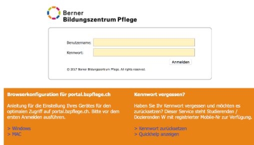
Screenshot Beispiel Anmeldung Studierende/Dozierende W

Danach fahren Sie weiter mit Punkt 3 (unten).